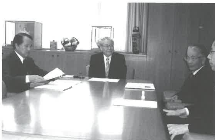
左から 池田康夫 横倉義武、高久史磨、別所正美の各氏

平成 25 年 4 月、厚生労働省の「専門医の在り方に関する検討会」のまとめを受けて、専門医の育成と専門医制度の確立を掲げて、本年 5 月 7 日に日本医師会、日本医学学会連合、全国医学部長病院長会議、日本専門医機構の代表者（写真）が参集し、登記申請書に調印ののち、その 4 名の代表者による記者発表が開催され、同日付で一般社団法人 日本専門医機構が発足しました。